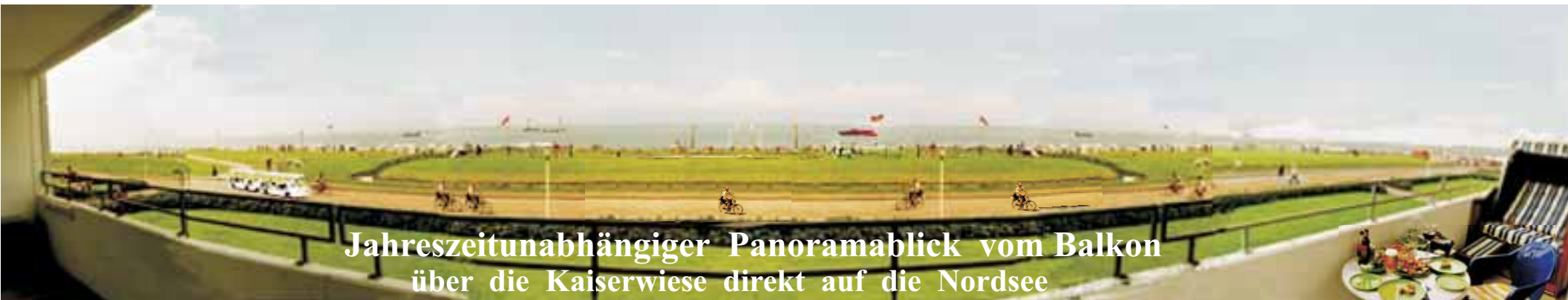
Jahreszeitunabhängiger Panoramablick vom Balkon über die Kaiserwiese direkt auf die Nordsee